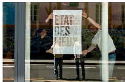
© Agence 360, Affiche de l'exposition 'Etat des Lieux' au 44 Gassendi, juin 2024

Une agence d'urbanisme, également lieu d'exposition de photographies, invite l'image à s'immiscer dans l'espace et à infuser les pratiques de projet. Comment une pratique visuelle s'impose dans la démarche de projet ?