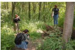
© Rahmona Soudani, Grand Paris sur le fil, 2024.

Des photographes font le choix de faire participer des personnes non-professionnelles en les incluant à plusieurs niveaux de la production du travail : conception, réalisation, voire restitutions du projet. Cette table ronde sera l'occasion d'interroger les spécificités et enjeux propres à la photographie partagée.