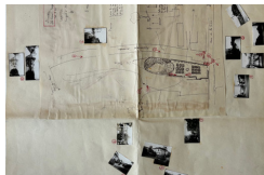
René Pechère, Dessin et photographies, Anney, Ile Saint-Joseph, 1959, CIVA©

En quoi l'approche photographique des sites de projet construit-elle un voir professionnel spécifique ? Les pratiques et productions photographiques de trois paysagistes, constitutives de méthodes de travail dès la rencontre du terrain, seront questionnées comme procédés de montage d'espaces par l'image.