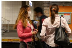
© Manon Marguerit et Félix Cardoso, extrait de l'affiche de la série Visibles, 2022.

Visibles est une série documentaire de 58 minutes réalisée par Manon Marguerit et Félix Cardoso en 2022. Durant trois épisodes, huit couples de lesbiennes évoquent les formes de violences qu'elles subissent dans les transports en commun franciliens et se confient sur les stratégies mises en place pour y faire face. Les participantes emmènent ensuite les réalisatrices avec elles sur un trajet. Dans le documentaire, les lesbiennes participantes mettent en scène leur relation dans un jeu de dévoilement et de dissimulation. Un des objectifs est de faire réagir les transporteurs, comme la RATP, engagés dans la lutte contre les violences sexuelles et sexistes.